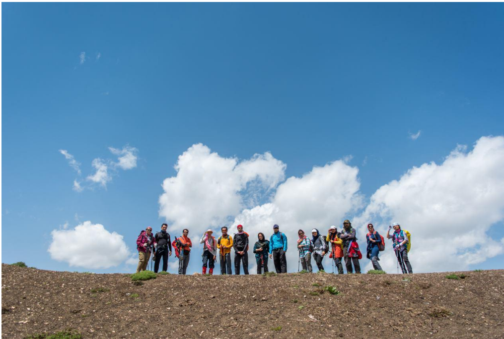
شکل ۴ گردنه زارگاه