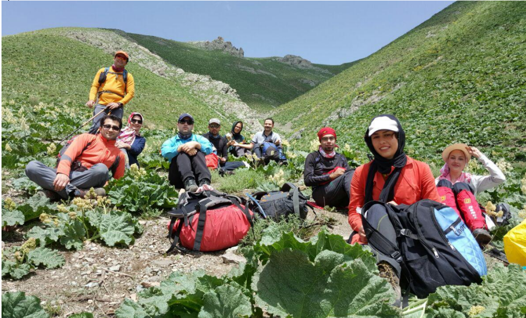
شکل ۳ استراحت قبل از شیب گردنه زارگاه