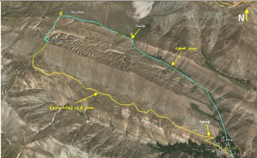
عکس و کروکی مسیر:

https://weather.com/weather/tenday/l/IRTR0019:1:IR