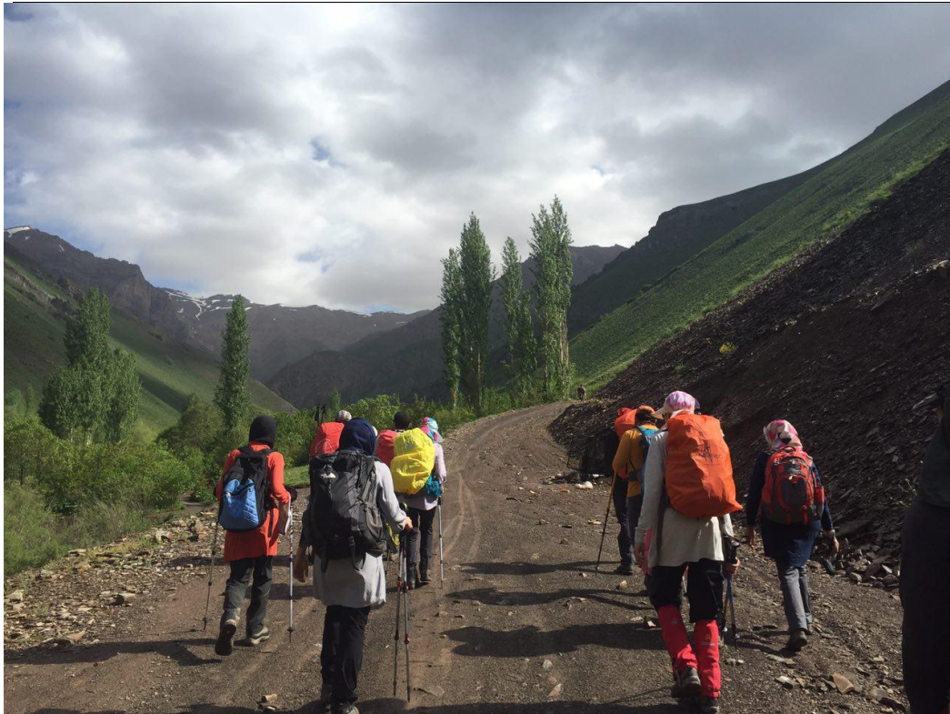
شکل ۱ مسیر صعود از روستای آهار به سمت روستای ده تنگه