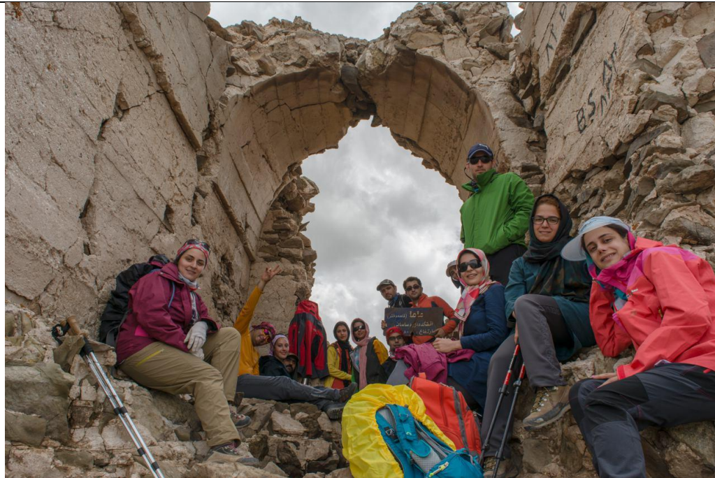
شکل ۵ قله زیبای قلعه دختر